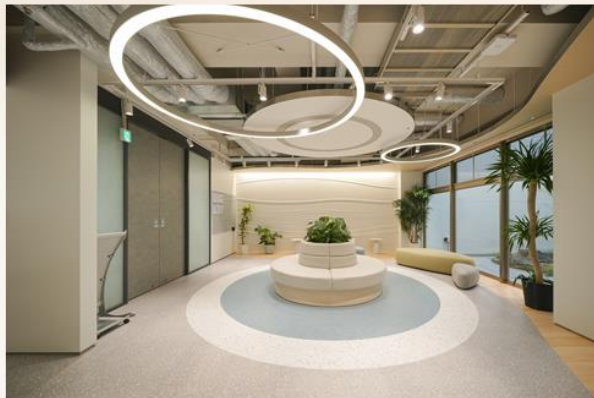
(右上)受付銘板 (右下)受付カウンター (左上)1階 相談室 (左下)総合ロビー